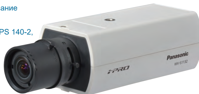
Объектив: поставляется отдельно